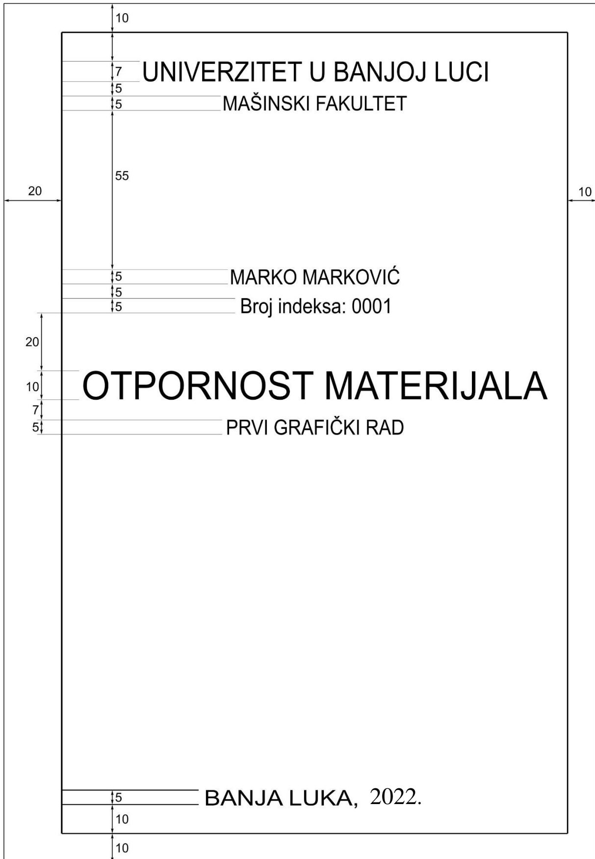
Sl. 2 Izgled naslovne strane grafičkog rada